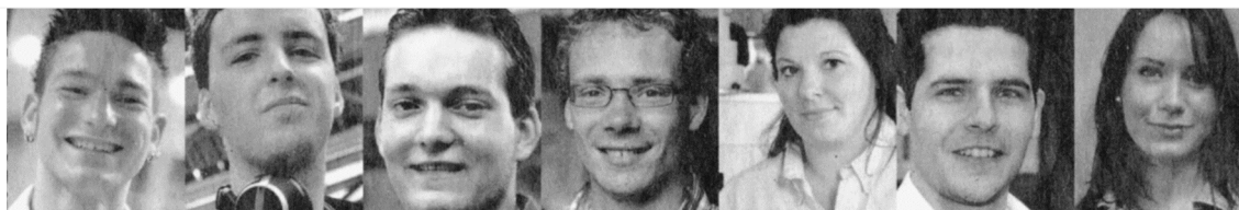
Coen Gerritse Da Vinci College