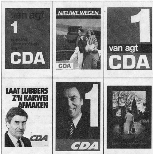
Posters van diverse CDA-campagnes.

ILLUSTRATIE UIT: CDA 25 JAAR VAN UITGEVERIJ AO (ACTUELE ONDERWERPEN) BV.