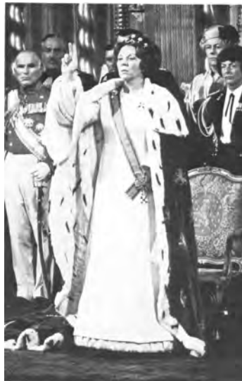
Eedaflegging van Koningin Beatrix op 30 april 1980