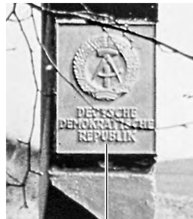
Duitse Democratische Republiek