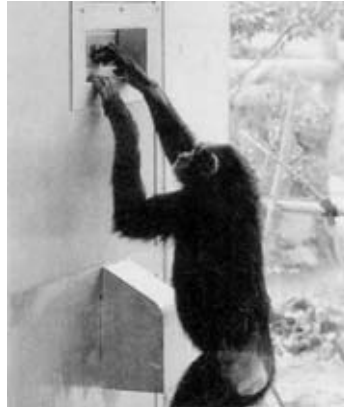
A Tokyo, la chimpanzé prodigue en pleine action. Etonnant, non?