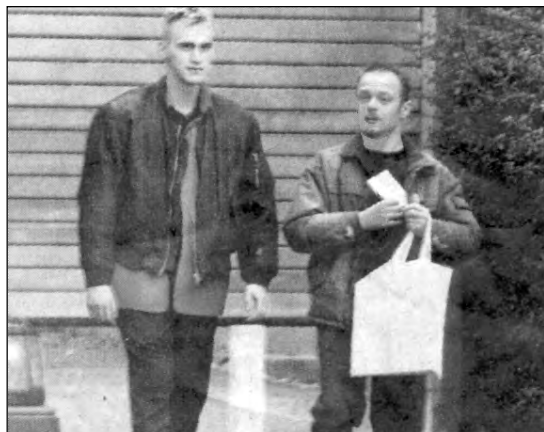
Die dümmsten Bankräuber Deutschlands waren nach dem Urteil wieder auf freiem Fuß.