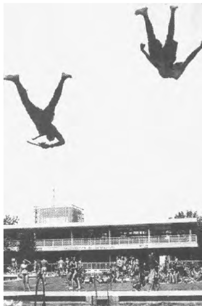
Der Moment, bevor aus Rotznasen Rothäute werden.