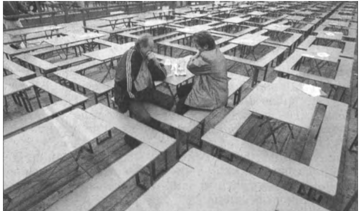
Reihenweise leere Tische. Nur wenige Leute ließen sich gestern in den Festzelten auf dem Münchner Oktoberfest die Maß Bier schmecken.